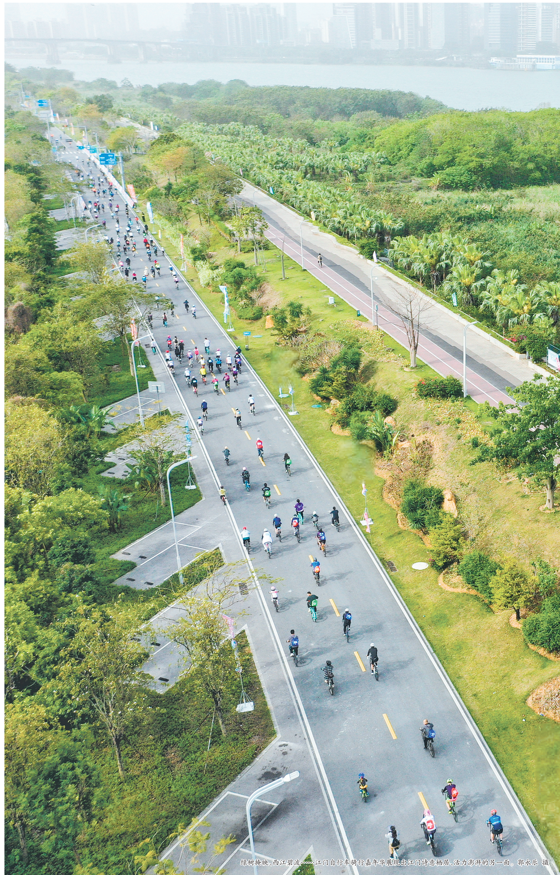
绿树掩映、西江碧波，江门自行车骑行嘉年华展现出江门诗意栖居、活力澎湃的另一面。

江门市新会区汽车摩托车运动联合会中有一支由一群对摩托车怀揣无限热爱的车友自发组建的车队。他们来自不同的背景，却因共同的热爱汇聚在一起，代表着江门地区活跃于众多丰富多彩的赛事与活动之中。这支车队始终坚守“安全、激情、团队”的宗旨，巧妙地将竞技的热血、探险的刺激与公益的温暖融为一体，同时，车队一直致力于推广摩托车运动文化。通过举办展览、培训等活动，让更多人了解并爱上这项充满魅力的运动。