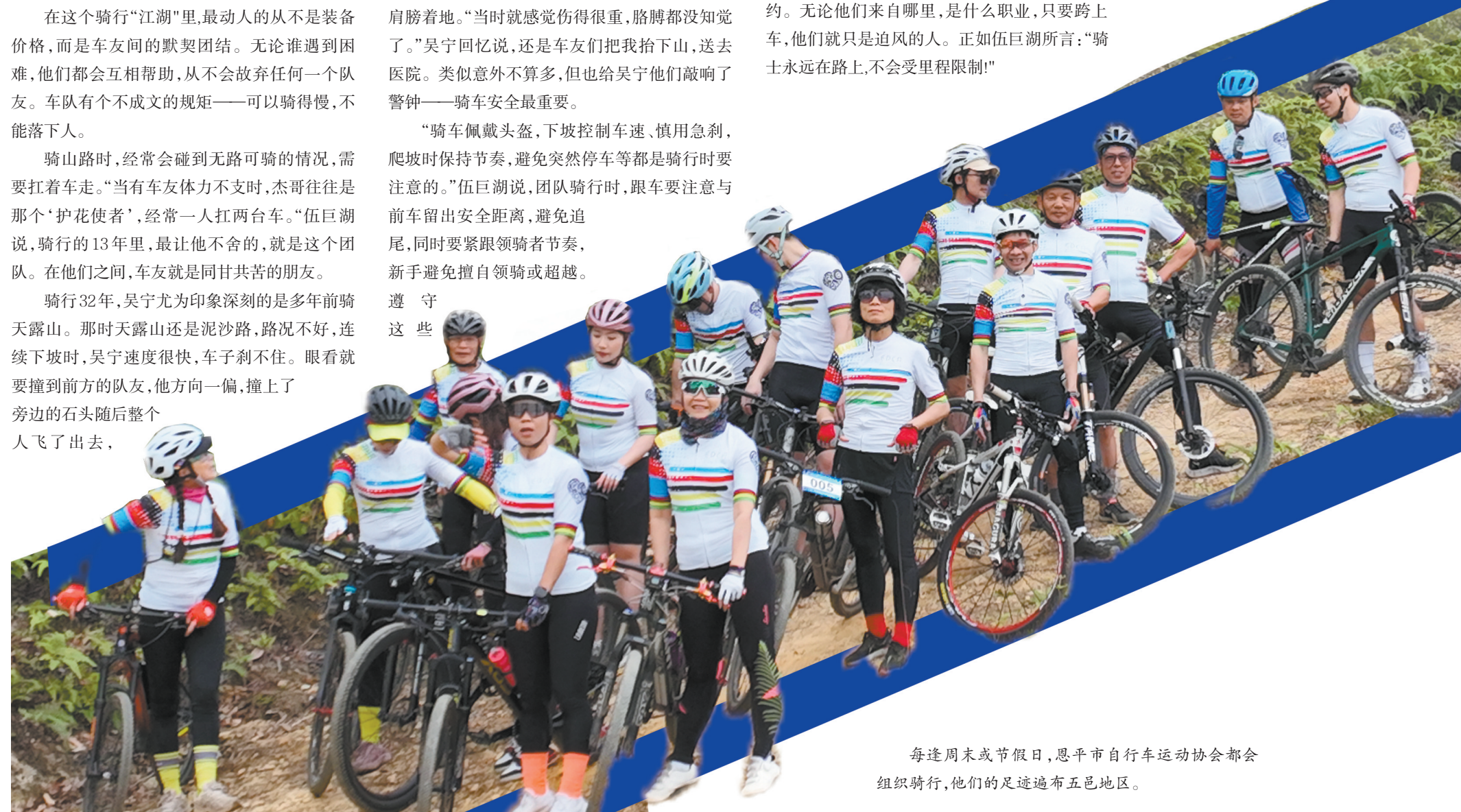
每逢周末或节假日,恩平市自行车运动协会都会组织骑行,他们的足迹遍布五邑地区。

与此同时,这群一直在路上的骑行者正将车轮印拓展至更远,时刻准备着奔赴下一场山海之约。无论他们来自哪里,是什么职业,只要跨上车,他们就只是追风的人。正如伍巨湖所言:“骑士永远在路上,不会受里程限制!”