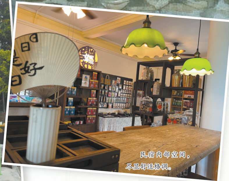
民宿内部空间， 尽显舒适格调。

藏巧思，从采光通风到卫生设施，适配现代生活需求。这种“外守其形，内焕其神”的改造，让百年碉楼既留住了侨乡记忆，又具备了宜居属性，成为杂志照片中最具故事感的取景地。