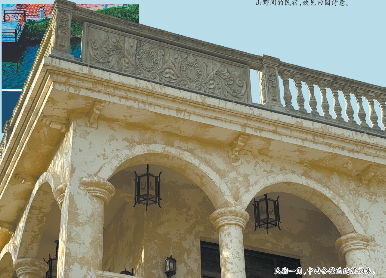
民宿一角，中西合璧的建筑韵味。

“我是三合人，从小就有一个梦想，以后要为家乡建设出力。前些年每次从国外回到家乡，看到日新月异的变化，那份回乡创业的决心就愈发坚定。深中通道、黄茅海跨海通道等交通工程，为港澳同胞前来旅游、生活、养老提供了便利条件，也为我们一样回乡创业的乡亲提供了更加广阔的发展空间。所以，我们回来创业了。”