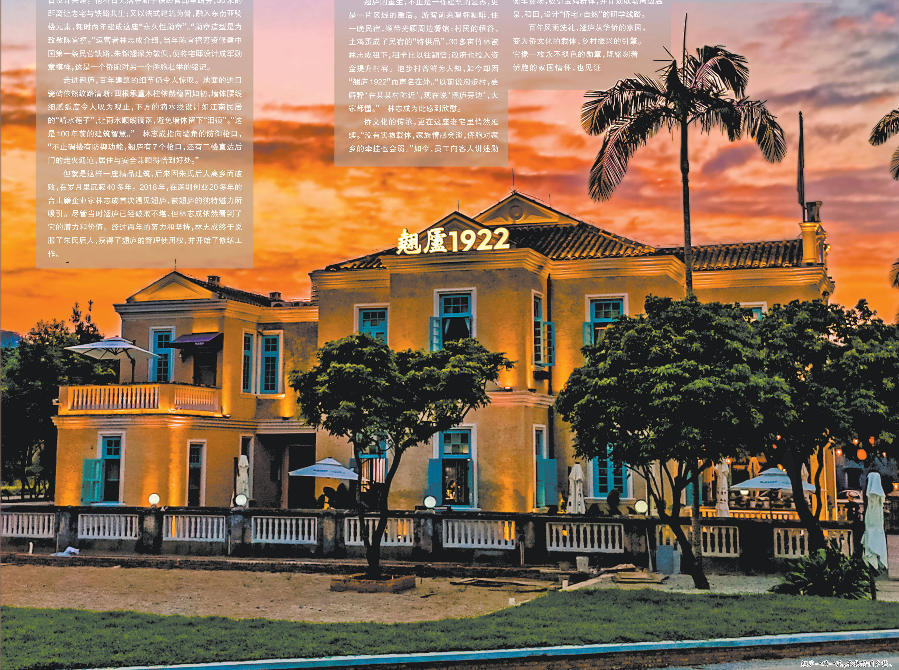
翘庐一时一风，承载侨国乡愁。

翘庐吸引我的，不仅是建筑本身的艺术价值，更是其背后承载的侨文化记忆。我们要做的，就是通过民宿载体，让这些动人的华侨故事被看见、被记住，让侨乡文化真正“活”在当下。