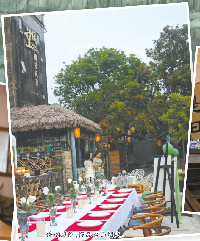
侨韵庭院，慢品台山烟火。

过程中，她坚守“修旧如旧”的原则，外立面完整保留了碉楼的原始风貌，未做过多修饰。内部却暗