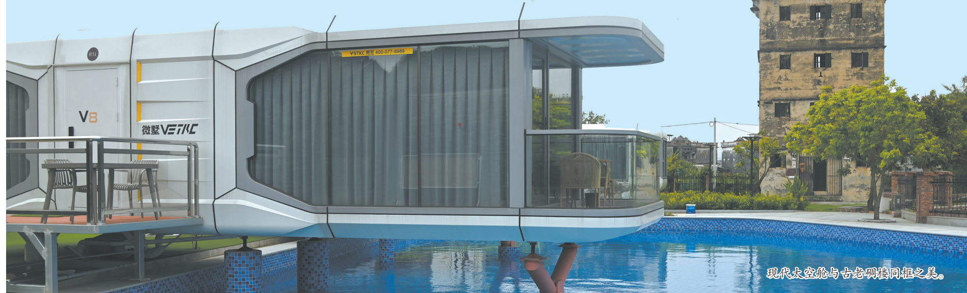
现代太空舱与古老碉楼同框之美。